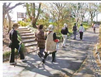
ノルディックウォーク体験会