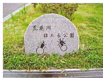
こんなデザインのものもあります