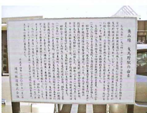
軽便鉄道の名残もところどころに残っています

モクレン通りは、浜松市音・かおり・光資源百選にも選ばれています。また、沿道には、軽便鉄道奥山線に関する看板なども設置されています。今度の春には、車から降りて、モクレンの香りを感じながら、軽便鉄道が走っていたころを思い浮かべながら散歩してみるのも楽しいのではないのでしょうか。