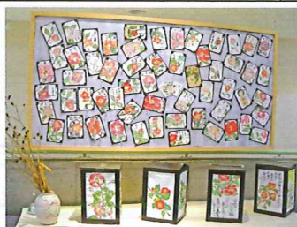
椿まつり(椿の絵手紙展)