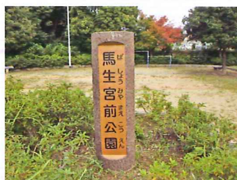
これはよく見かけるかな