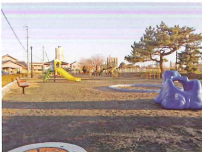
馬込川公園（整備中）