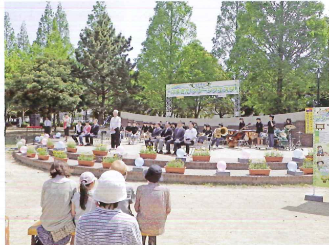
毎年、開園記念日の4月29日には、「はまきたグリーンフェスタ」が開催されます。