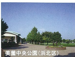
美園中央公園(浜北区)