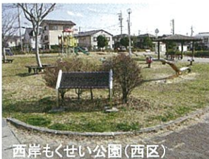
西岸もくせい公園(西区)

近隣公園 街区公園に、運動広場や樹木を加え、半径500m以内に住んでいる人たちが利用できるよう、2haの面積を標準として配置された公園です。