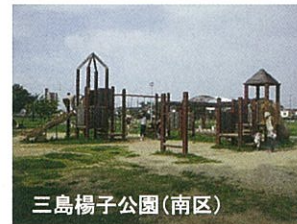
三島楊子公園(南区)

野口公園（中区） 富塚公園（中区） 大蒲公園（東区） 堀出前中央公園（西区） 香公園（北区） 染地台野鳥公園（浜北区）