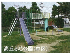
高丘ふじ公園(中区)