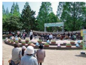
はまきたグリーンフェスタ