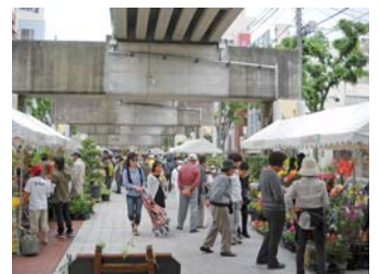
はままつ春の都市緑化フェア