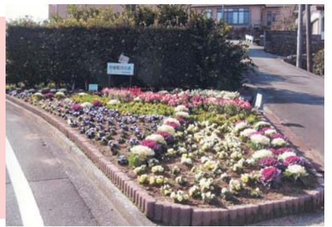
沿道はいつも花でいっぱいです