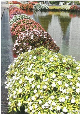
サンパチェンス® 水上花壇