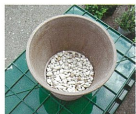
②底に、1/5程度軽石を敷き詰めます。