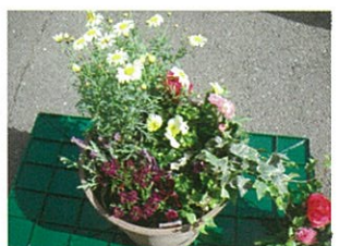
④レイアウトを考えます。高くする場所、色の配置など