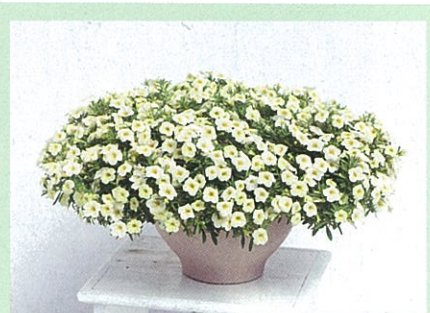
ふわリッチ クリーム

2014年春からお店に並ぶニューフェイス。6色でお目見えです。今までのカリブラコアは、茎が伸びやすく摘心などの作業に手間がかかりました。「ふわリッチ」は多くの花が咲きながらコンパクトにまとまります。