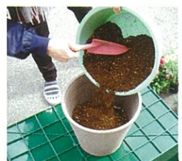
③コンテナの半分くらいまで土を入れます。