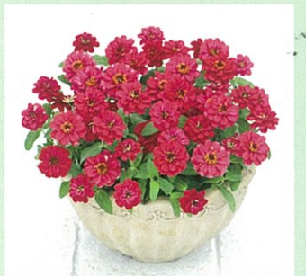
プロフュージョン ダブル ホットチェリー

目の覚めるような色彩のサカタのタネ オリジナル品種。次々と開花し、花壇の主役に最適です。他の品目や「プロフュージョン」の他色との組み合わせで、開花期間の長い、省エネ花壇が楽しめます。