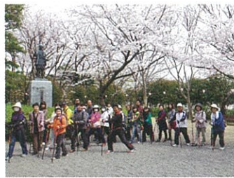
サクラの下でノルディックウォーク