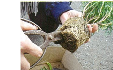
⑥根がびっしりと詰まっていたら底に切れ込みを入れ根をほぐします。