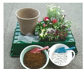
①材料を準備します。

春の日差しを浴び、花の色が鮮やかに映える季節になりました。思い思いの春色の花々でコンテナをつくってみませんか？コンテナガーデンは、個人の楽しみの世界です。作り手が楽しければその作品はそれで素晴らしいのではないかと思います。ただ、一つ大切なことさえ守っていれば、それは、植物にとって良い環境かどうかという点です。植物にとって良い環境であれば、それぞれの植物が美しい花を咲かせ素晴らしい作品となるでしょう。コンテナガーデン作りのポイントは土作り、肥料、植え方、メンテナンスとありますが、今回は、植え方のポイントをお話します。