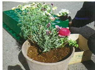
⑦レイアウトどおりに植付けます。