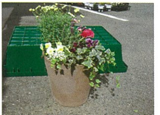
⑧コンテナの底から水がでるまでたっぷり水をあげて完成です。