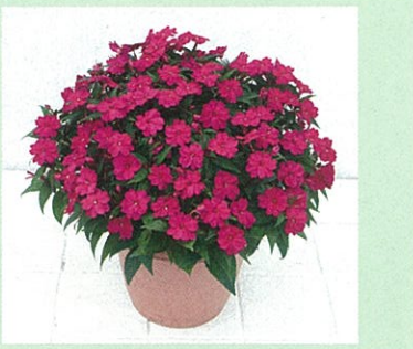
サンパチェンス® マジェンタ

日本全国ですっかりおなじみとなった「サンパチェンス®」。厳しい夏の暑さにも負けず春から秋まで咲き続けます。また、空気中の二酸化窒素や水中のリン酸などを浄化する力も強く、環境にも優しい優れものです。