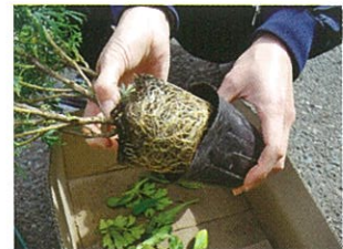
⑤ポットの周りを軽く揉みながらポットから抜きます。