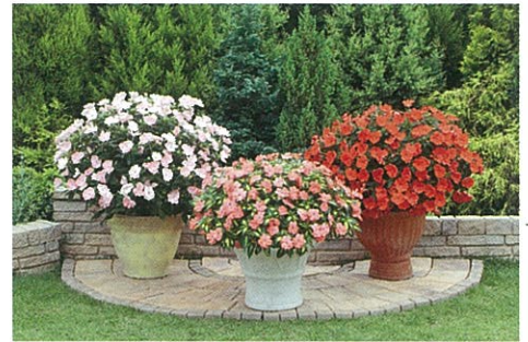
サンパチェンス® 利用例