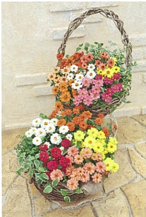
プロフュージョンの寄せ植え