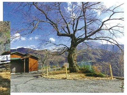
保護作業：桜のまわりに柵を設置