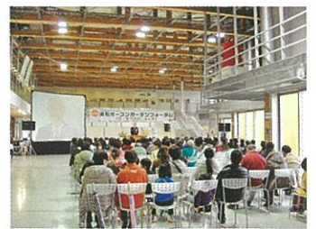
オープンガーデンフォーラム