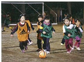
ジュニアなでしこサッカー教室