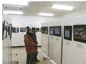
佐鳴湖自然作品展

佐鳴湖自然作品展に 展示する作品を募集します。 申込受付：2月2日(月)～27日(金) 詳しくは佐鳴湖北岸管理棟まで！ ☎476-0210