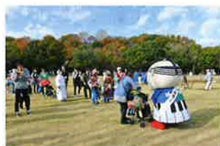
浜松城公園 紅葉まつり