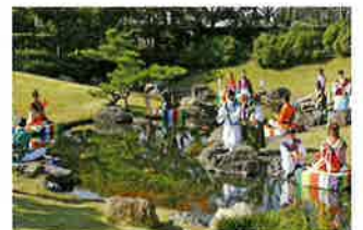
浜松市浜北万葉まつり