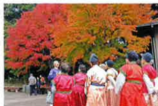
万葉の森公園もみじまつり