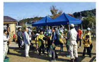
佐鳴湖公園へ出かけよう！