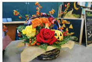
バラのハロウィンアレンジ