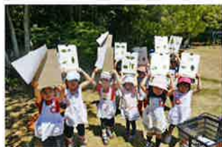
もりのあそび講座（浜松城）